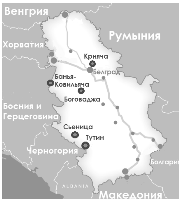
Рис. 1. Географическое расположение постоянных центров приема мигрантов и беженцев в Республике Сербия (Авторская модификация. Источник: https://www.azilsrbija.rs/apc_network/ ) Fig. 1. Geographic location of permanent reception centers for migrants and refugees in the Republic of Serbia (Author's modification. Source: https://www.azilsrbija.rs/apc_network/ )

В отдельных центрах нашим волонтерам разрешили заходить в здания центра, в других – только находиться на дворовой территории. В отдельных центрах волонтеры общались с респондентами в присутствии работников центра, в других – им было разрешено общаться с респондентами непосредственно. Поскольку часть резидентов центров не владела английским, в ходе исследования возникла необходимость в переводе и разъяснении анкет на национальные языки. В большинстве центров к волонтерам был прикреплен профессиональный переводчик, занятый в центре, в других – установлению коммуникации способствовали сами мигранты. Таким образом, часть мигрантов заполняла анкеты самостоятельно, другая же часть – при помощи волонтера, переводчика или своих коллег. Участие в анкетировании было добровольным и анонимным, респонденты могли выйти из исследования в любой момент (отказ отвечать на все или какие-то вопросы анкеты подразумевал выход из исследования). Несовершеннолетние резиденты центров участвовали в анкетировании по разрешению своих родителей или опекунов. Непосредственно по результатам исследования мы смогли получить картину распределения респондентов, принявших участие в нашем опросе, по постоянным центрам приема мигрантов и беженцев в Республике Сербия (рис. 2.)