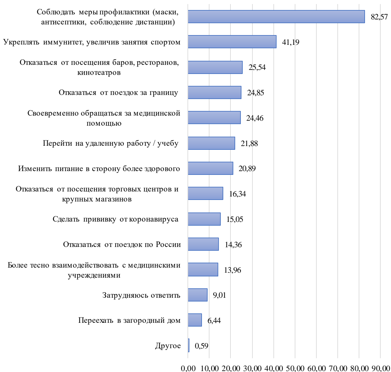
Рис. 2. Распределение ответов на вопрос: «В случае начала очередной новой волны эпидемии что из перечисленного Вы готовы будете ответственно соблюдать или делать, если возникнет угроза введения новых ограничений? (укажите не более 5 вариантов ответа)», %